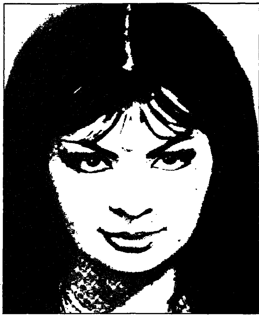
شهرزاد في صورة من بداياتها الاولى